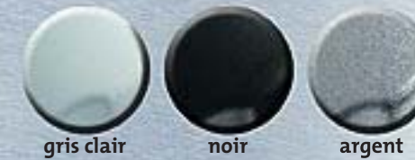
gris clair noir argent